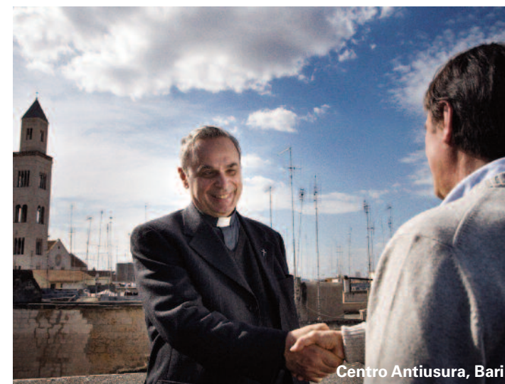
Centro Antiusura, Bari

Tra i progetti nazionali realizzati c'è il soccorso alle vite "strozzate". L'8xmille contribuisce infatti al funzionamento della Consulta nazionale antiusura, che in questi anni ha liberato un nucleo familiare al giorno dall'indebitamento e dal racket. Una speciale azione di sacerdoti e volontari le accompagna nel complesso percorso legale e nel rientro debitorio, con 28 fondazioni, presenti in quasi tutte le regioni italiane.