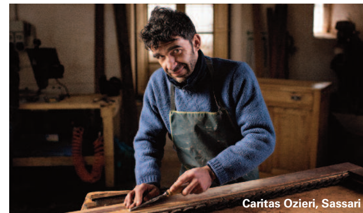
Caritas Ozieri, Sassari

Come nel caso delle cooperative sociali sostenute anche dall'8xmille e promosse in diverse diocesi italiane. Come quella della Caritas di Ozieri, in provincia di Sassari, che ha avviato un panificio, una falegnameria, un laboratorio di serigrafia e una fabbrica di ostie. Creando posti di lavoro locali, in tempi di crisi economica.