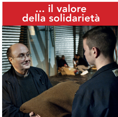
... il valore della solidarietà