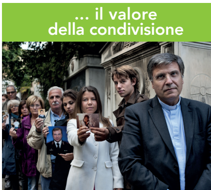
... il valore della condivisione