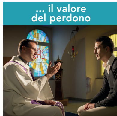
... il valore del perdono