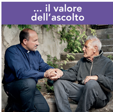
... il valore dell'ascolto